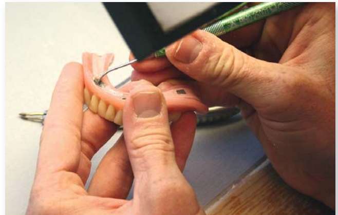
Abb. 11: Nach dem Einkleben werden noch Korrekturen an der Prothesenbasis durchgeführt.

Fahrt in die Ordination bemerkte mein Großvater, dass meine Mutter den Termin absagen wollte und sprach sie auf ihre Zweifel an: „Du und ich, wir haben die