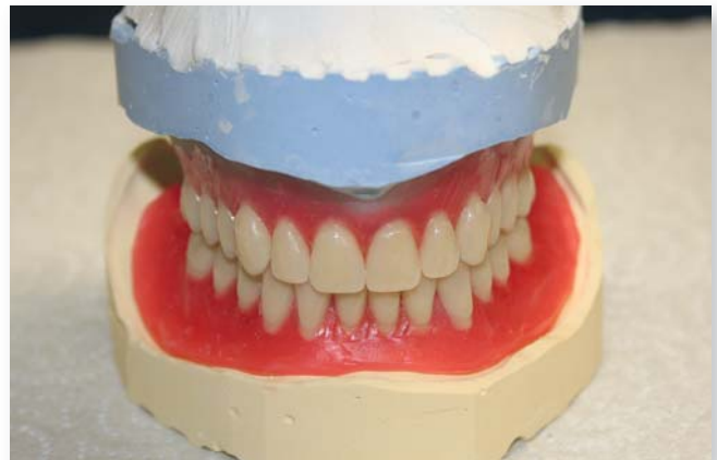
Abb. 9: Oberkiefer- und Unterkiefer-Wachsaufstellung