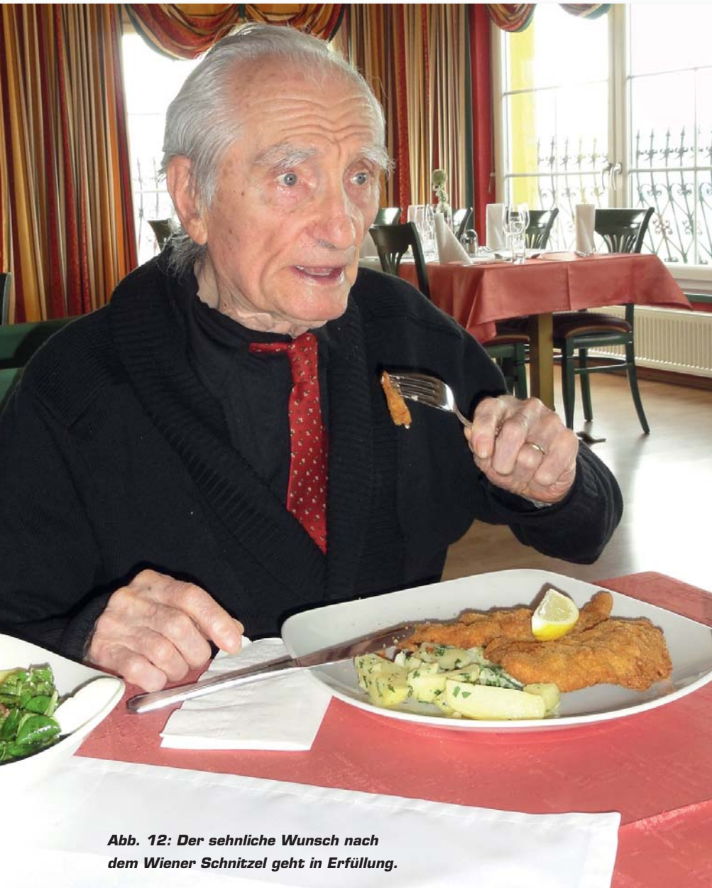
Abb. 12: Der sehnliche Wunsch nach dem Wiener Schnitzel geht in Erfüllung.

Mein Großvater hatte Lust und Freude am Essen ( Abb. 12 ) wiederentdeckt. Er trug die Prothese zwei Jahre, bis er im August 2012 im Alter von 98 Jahren verstarb. Resümierend muss ich sagen, dass es natürlich unter Berücksichtigung der Krankengeschichte und der Frage nach der häuslichen Pflege keine leichte Entscheidung war, jedoch empfand mein Großvater jeden Tag mit der neuen Prothese als Geschenk – und genau dieses Wissen begleitet mich seither in meiner Ordination.