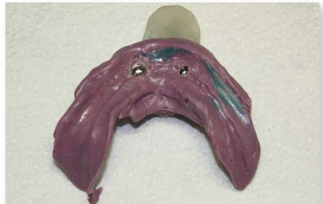
Abb. 5: Die Titanmagnetics Prothesenmagnete stecken in der Abformung, die systemeigenen Modellanaloge werden magnetisch angezogen.

Mein Großvater, Jahrgang 1914, war seit seinem 60. Lebensjahr Prothesenträger. Ich kannte ihn von Geburt an sozusagen nur mit Zahnprothese. Mit zunehmendem Alter fand eine stetige Atrophie des Unterkieferkamm statt, wodurch mittlerweile nur mehr ein planer Unterkieferkamm vorzufinden war. Dadurch hielt die Prothese gar nicht mehr, mein Großvater verlor immer mehr die Lust am Essen und zog sich auch aus dem gesellschaftlich wichtigen gemeinsamen Mittagessen zurück, da es ihm peinlich war, die Mahlzeiten aufgrund des mangelnden Prothesenhalts nicht essen zu können und unangetastet stehen zu lassen.