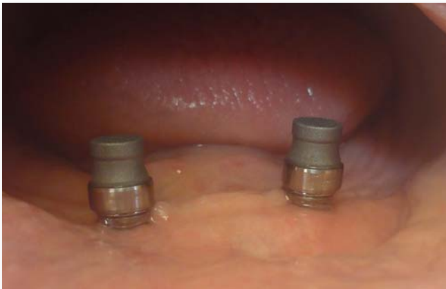
Abb. 10: Die Titanmagnetics K-Line Prothesenmagnete auf den Resilienzringen vor dem Einpolymerisieren in die Prothese