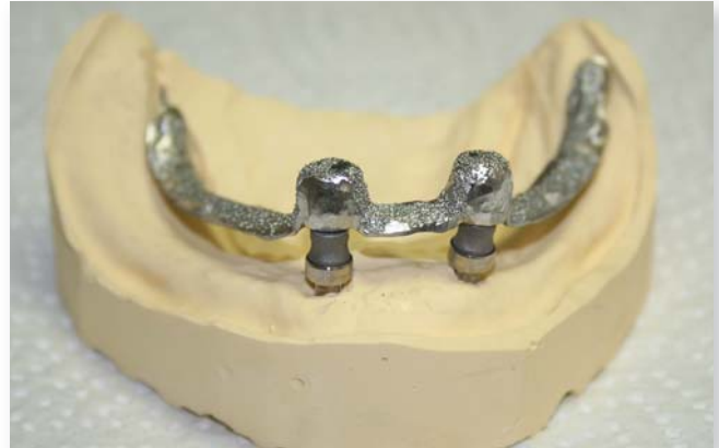
Abb. 7: Die Modellgussbasis zur Stabilisierung der Prothesenbasis wurde in die Unterkieferprothese eingearbeitet.