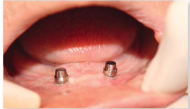
Abb. 3: Ein Blick auf die Titanmagnetics K-Line Inserts im Mund