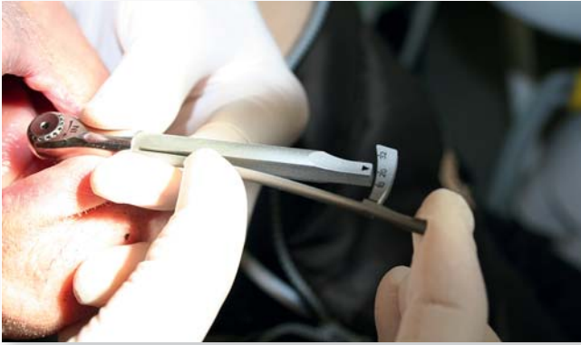
Abb. 2: Die Titanmagnetics Inserts werden mit 20 Ncm Drehmoment eingeschraubt.