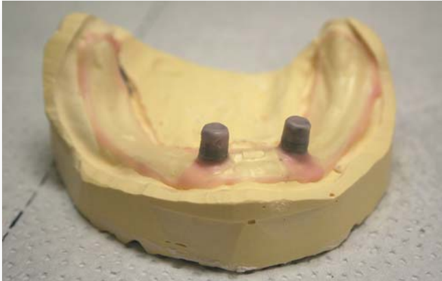
Abb. 6: Die Prothesenmagnete werden auf dem Vorbereitungsmodell als Platzhalter für die Aufnahme in der späteren Modellgussbasis genutzt.