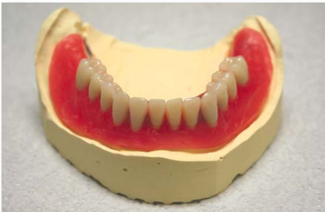
Abb. 8: Unterkiefer-Wachsaufstellung auf dem Modell