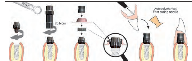
Insert Ratscheneinsatz Resilienzring/Positionsmanchette Prothesenmagnet

Positionsmanchette / Resilienzring sie dienen dem lagerichtigen Einpolymerisieren des Prothesenmagnetes und vermeiden das Zusammentreffen der beiden Magnete